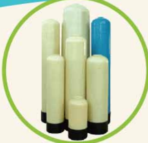
Tank Size 6" - 70"