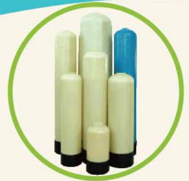
Tank Size 6" - 70"

เครื่องกรองเรซิน Innovatek แบบอัตโนมัติ ผลิตจากถังไฟเบอร์กลาส และชุดควบคุมคุณภาพเขียนจากบริษัท Pentair water USA ระบบออกแบบ เพื่อกำจัดหินปูนออกจากน้ำและทำการล้างตัวเองอัตโนมัติโดยใช้การตั้งเวลาหรือคำนวณจาก ปริมาณน้ำที่ใช้ซึ่งทำให้ เครื่องกรองน้ำ Innovatek สามารถติดตั้งและซ่อมบำรุง ได้ง่าย